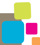
Plate-forme de soins palliatifs

Association pluraliste réunissant localement les acteurs de la santé autour de la question de la fin de vie